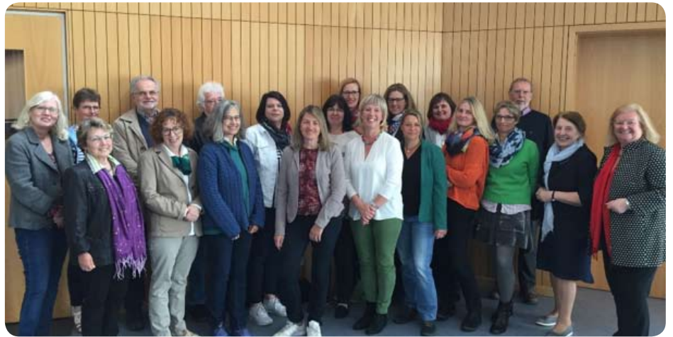
Alle MitarbeiterInnen (Vorstand, Beraterinnen und Verwaltungsangestellte) von donum vitae Hessen

Dank gebührt auch unserem donum vitae Bundesverband, der uns mit Rat und Tat zur Seite steht.